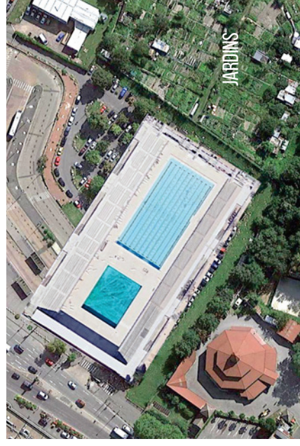
PISCINE DES JEUX OLYMPIQUES DE BARCELONE

C'est une évidence, la piscine olympique s'implante facilement sur ce terrain déjà artificialisé. Ci-contre nous voyons que d'autres piscines olympiques comme celles de Barcelone et d'Athènes tiendraient facilement sur ce parking sans détruire un micropouce de ces jardins.